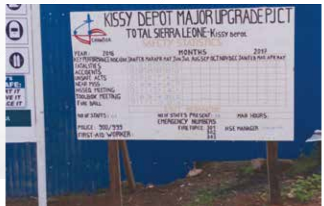
Safety Statistic (Depôt Kissy total S L)