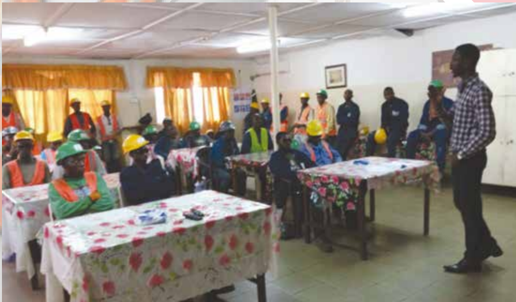
Réunion hebdomadaire de formation HSE(Depôt Kissy total S L)

Dans cette optique, nous avons choisi de nous engager et de maintenir un système de management SSE volontaire et d'amélioration continue, reposant sur le référentiel commun MASE / UIC version 2014 .