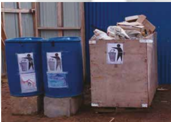
Gestion environnement (Depôt Kissy total S L)